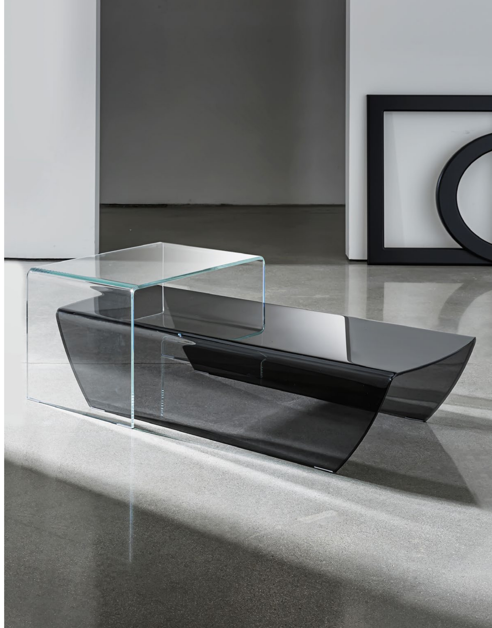
Taky TTFE. Bridge TETE.