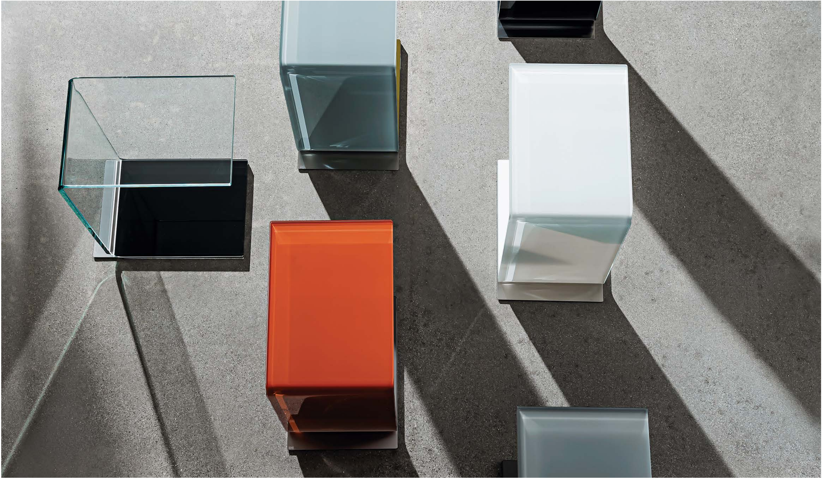
Swan TETE-TEN1, TER4, TEB1