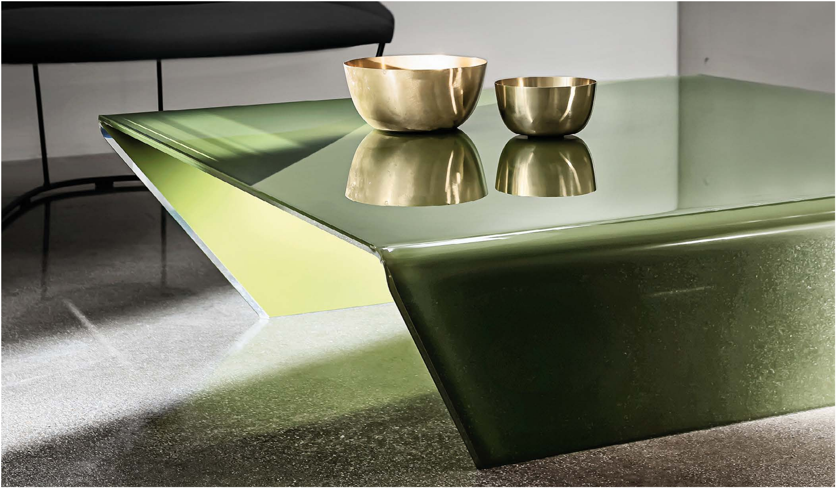
Rubino coffee tables TEV2